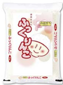
道南地区限定パッケージ