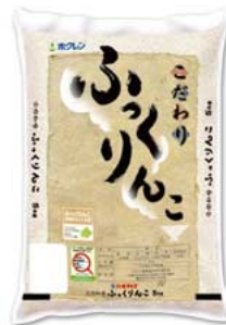
全道販売展開用(道南地区以外)米袋パッケージ